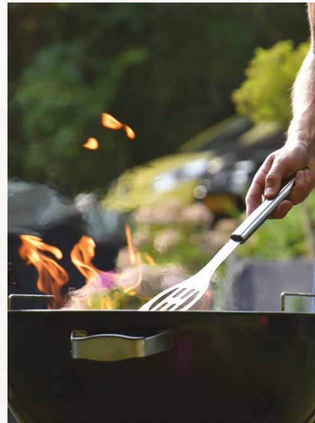
Zona de BBQ